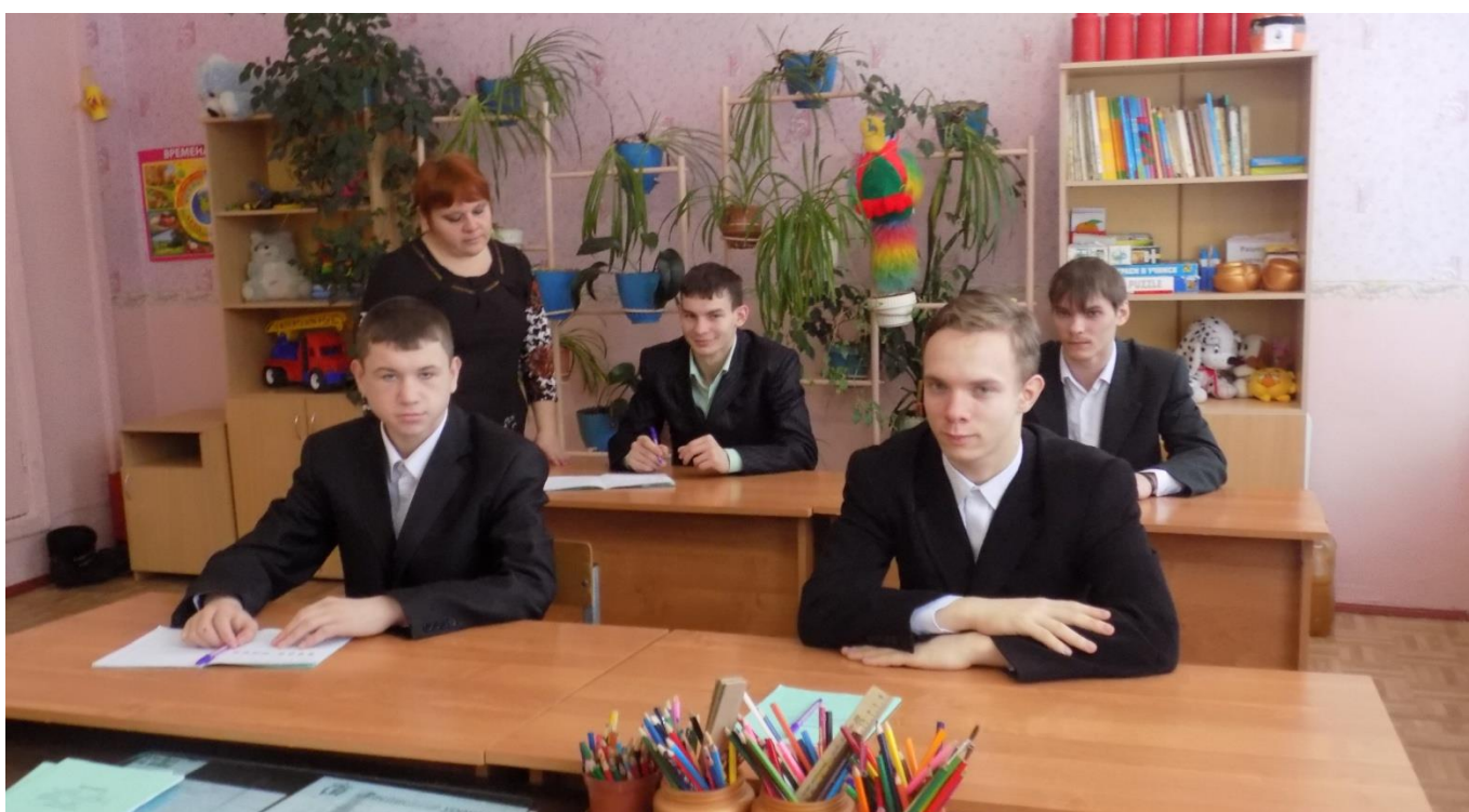
Урок русского языка в 6 классе.