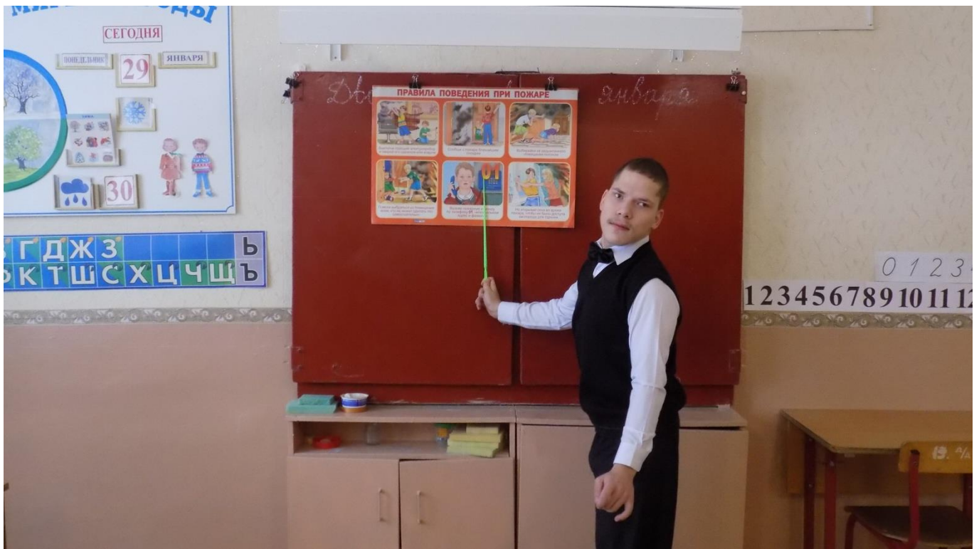
Работа у доски.