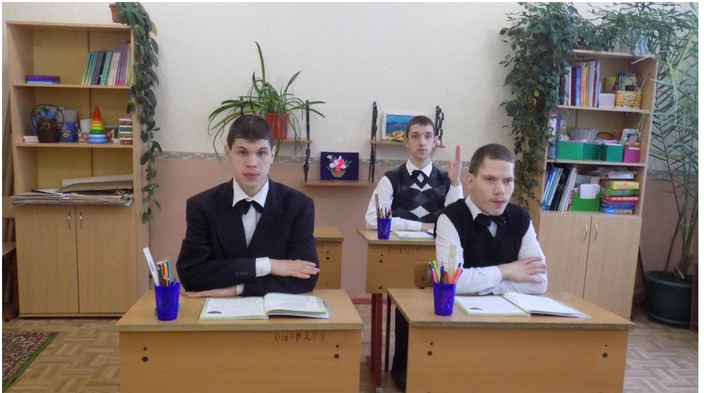
Урок чтения в 6 классе.