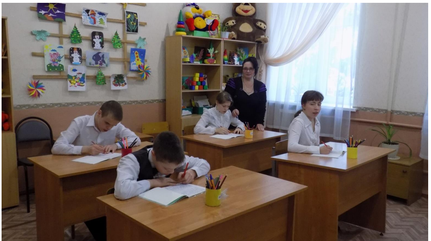
Урок математики в 5 классе.