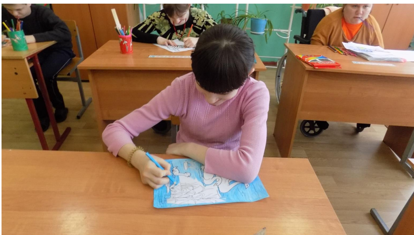
Урок рисования в 5 классе.