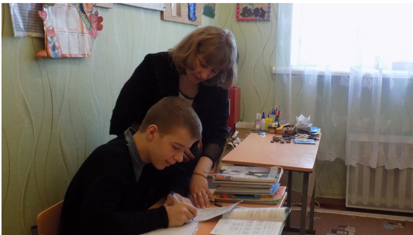
Индивидуальное занятие по математике с обучающимся 7 класса.