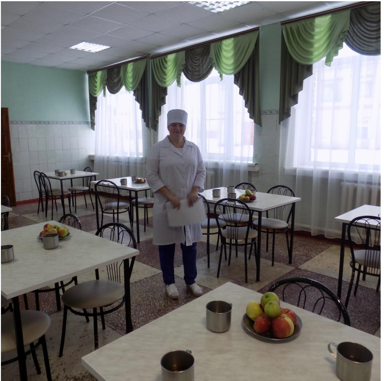
Питание воспитанников соответствует принципам щадящего питания.